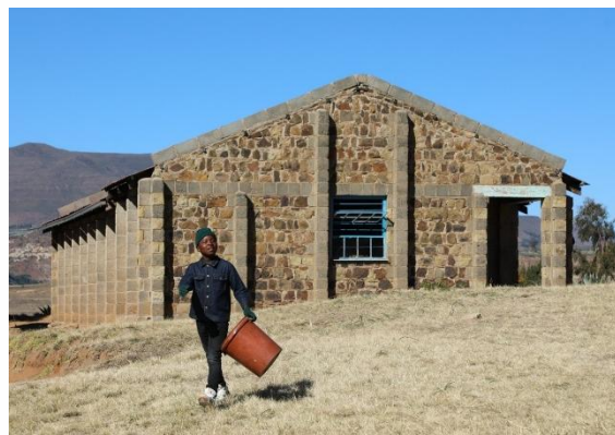
位於萊索托的馬普滕地區，因著極端天氣的影響，水資源嚴重缺乏。當地學生被迫於上課時間到受污染的河流取水，因而影響學習；校內衛生設備不足，以致水源性疾病頻發，嚴重威脅學生健康。

詳情： https://www.worldvision.org.hk/redpacket/school