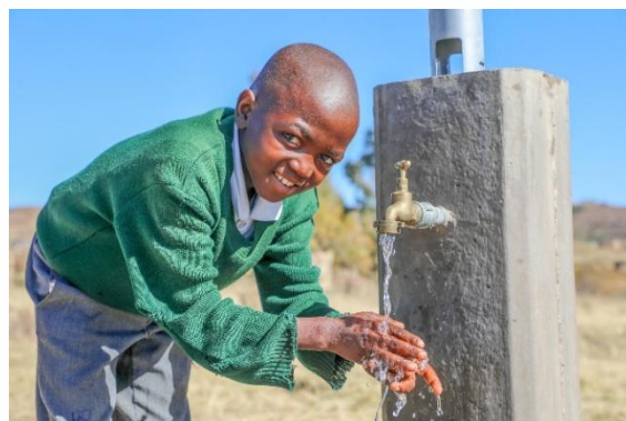
宣明會於校內安裝了供水系統及洗手設施，11歲的莫科勒表示：「現在，我們每天都可以洗手、清洗餐盒，還可以喝乾淨的水！我們甚至可在校內種植蔬菜、為蔬菜澆水，我們為自己的學校感到驕傲！」