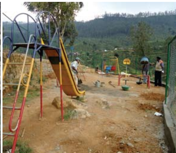
「區域發展項目」在區內加設康樂設施，讓孩子享用。