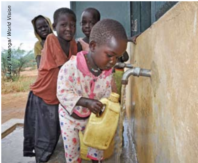
盧雅柏小學的學生排隊取水，現在他們不用冒生命危險去河邊打水。