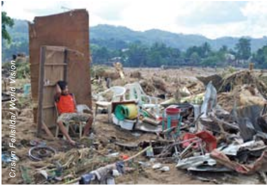
災民一夜之間喪失家園、財物，甚至親人，只留下一臉茫然。

當風暴將近，宣明會已與當地組織提醒住在山坡、低窪地帶及容易水浸地區的居民關於山泥傾瀉及洪水的危險。可惜洪水於半夜淹至，很多居民仍在睡夢中，而且洪水急速上漲，令很多被困在屋內的人傷亡，特別是難以逃生的孩子及長者。