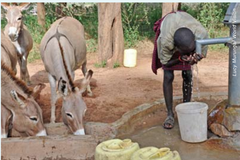
盧雅柏村的供水點前，小孩在水龍頭喝水，牲口在水槽喝水，不會構成污染。

唉，他們只不過是一群小學生，要到河邊打水。他們不得不去，人不能不喝水，但是他們很害怕，他們說那段路程有如死亡甬道。他們住在肯尼亞圖爾卡納地區，區內治安不靖，搶掠牛羊群的匪徒持械出沒，這些人是隨意殺人的歹徒。學校附近