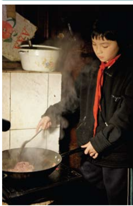
自母親離家出走，十歲的千千除了上學讀書，還要照顧父親的起居飲食。

落葉歸根，從來是他鄉遊子，老來所盼； 但時至今日， 對隨父母出城謀生的流動兒童， 年紀小小已日思夜盼，告別城市， 歸園田居！