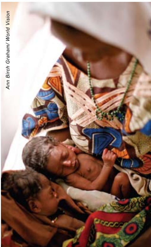
母親亞德因營養不良，沒有足夠母乳餵哺初生的孿生女兒，惟有用牛奶及羊奶餵哺，令她們病倒。

為免令西非糧食危機加劇，宣明會已採取多項行動，包括優先推行挽救營養不良兒童性命的項目、為農民提供種子、在尼日爾與世界糧食組織共同為接近六萬五千人推行以工換糧計劃，亦與政府合作支援農民，保護他們的牲畜及加強糧食保障。■