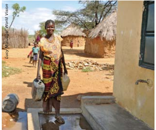
愛麗絲現在不必走六公里路去打水，因為明會為村莊提供了供水設施。