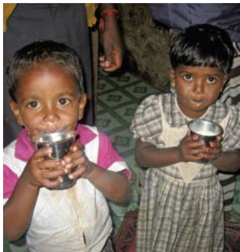
透過營養項目，孩子能享用牛奶，補充營養，健康成長。