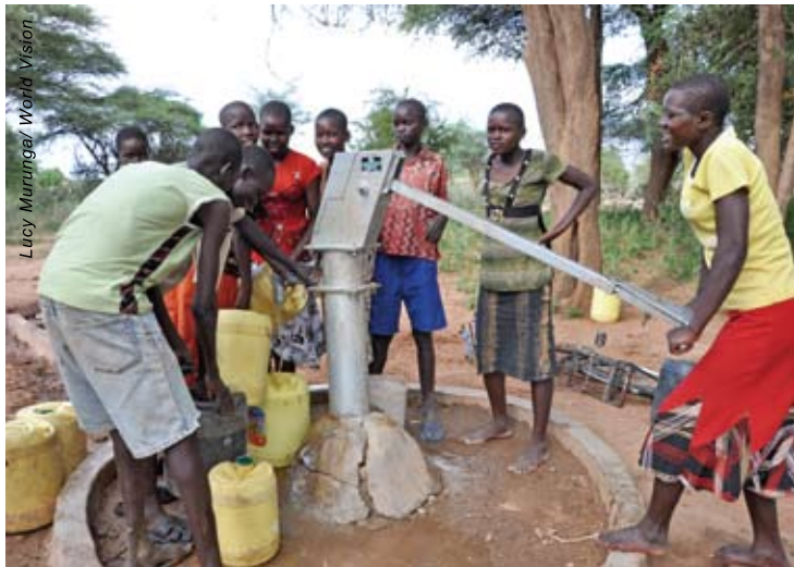
一群女孩在供水點打水，不用長途跋涉、不用冒險，難怪都顯得很輕鬆。

只有這河水可以提供水源，這些學生不得不冒險到河邊打水和沐浴。他們的老師惟有持槍護送他們，在他們沐浴時，為他們放哨。