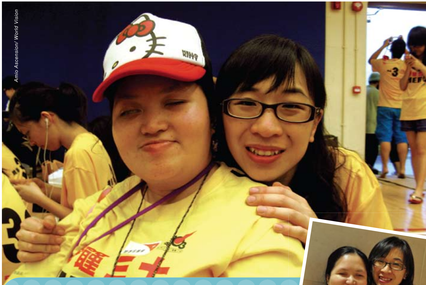
Amio Ascension/ World Vision