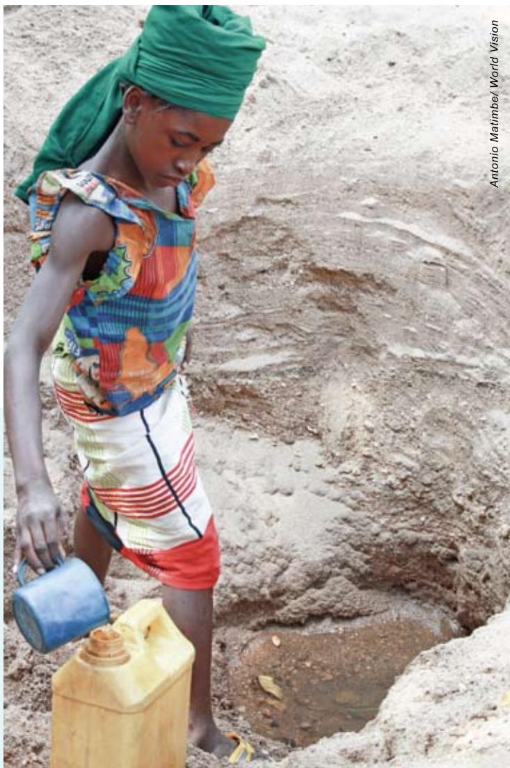
莫桑比克九歲的亞達妮五點鐘就起床，到河床挖出來的洞取水，然後頂著十公升水回家。她說：「回家後我急忙去上學，我很累，在上課時經常睡著。」