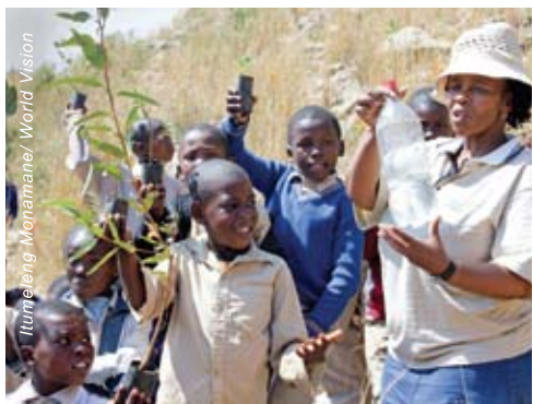
孩子透過植樹，學習預防土壤侵蝕，保護環境。