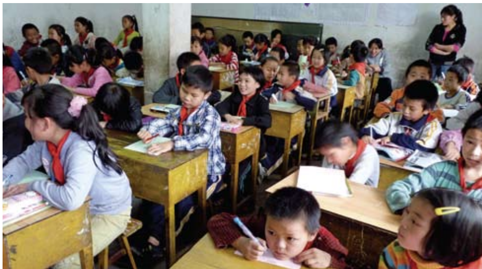
由於未能入讀公立學校，千千只有在既擠迫又缺乏教育資源的民辦學校讀書。

擺脫貧窮、不再飄泊，是流動兒童所想所盼，卻彷彿被湮沒在城市的繁華中，遭遺忘，沒出路。