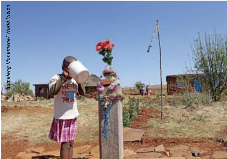
萊索托一名女童在水龍頭喝水。村中自從有供水及修建廁所以後，兒童健康大為改進。