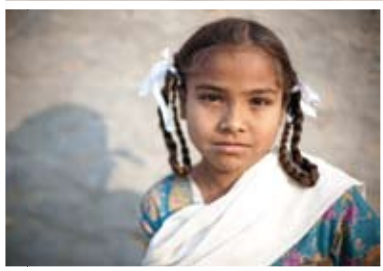
桑娜無父無母，與年邁的婆婆相依為命，前路茫茫。