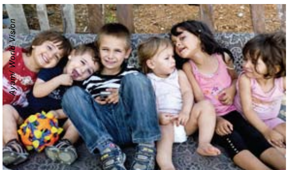
無論「第七十億人」在哪裡出世，他都活在一個矛盾的世界，面對不少挑戰。

(七) 雖然全球人口增長放緩，但現時在生育期的人超過三十億，代表未來數十年有更多孩子需要我們照顧。