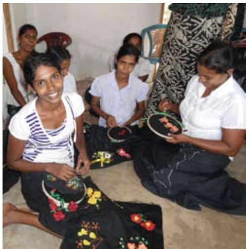
宣明會為區內婦女開設縫紉班，提升她們的能力，亦可幫補家計。