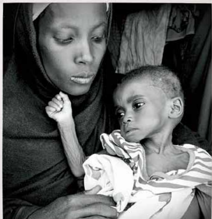
飢餓孩子 命懸一線