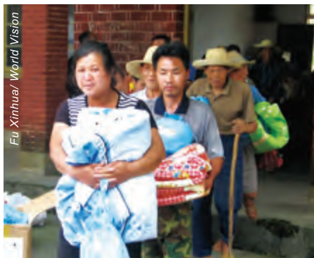
湖南省安化縣災民獲發棉被和生活用品包。

宣明會已密切留意災情發展，特別在設有「區域發展項目」的江西、廣西、貴州及雲南等地，並且已派員到受災嚴重的湖南及江西省評估災