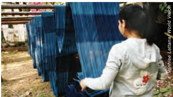
十五歲的美美（化名）被迫在一個泰國家庭工作超過一年，並且沒有任何工資。她起初誤信介紹工作的中介人，以為可以賺到不少錢，幫補家計。

那樣嚴重，所以那些罪犯得以逍遙法外。由於難以確認這些受害者，又或他們並非在本地被剝削，所以大部分人口販賣的受害者難以獲得援助，而販賣人口者則可以繼續剝削其他人。