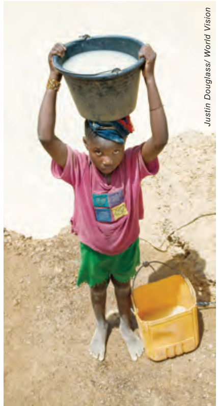
非洲很多地區都缺乏清潔食水，衛生設備欠佳，容易導致砂眼。布隆迪就是其中一個。