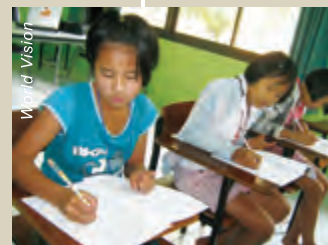
在宣明會舉辦的數學營中，小朋友寓學習於遊戲中，感到趣味盈然。