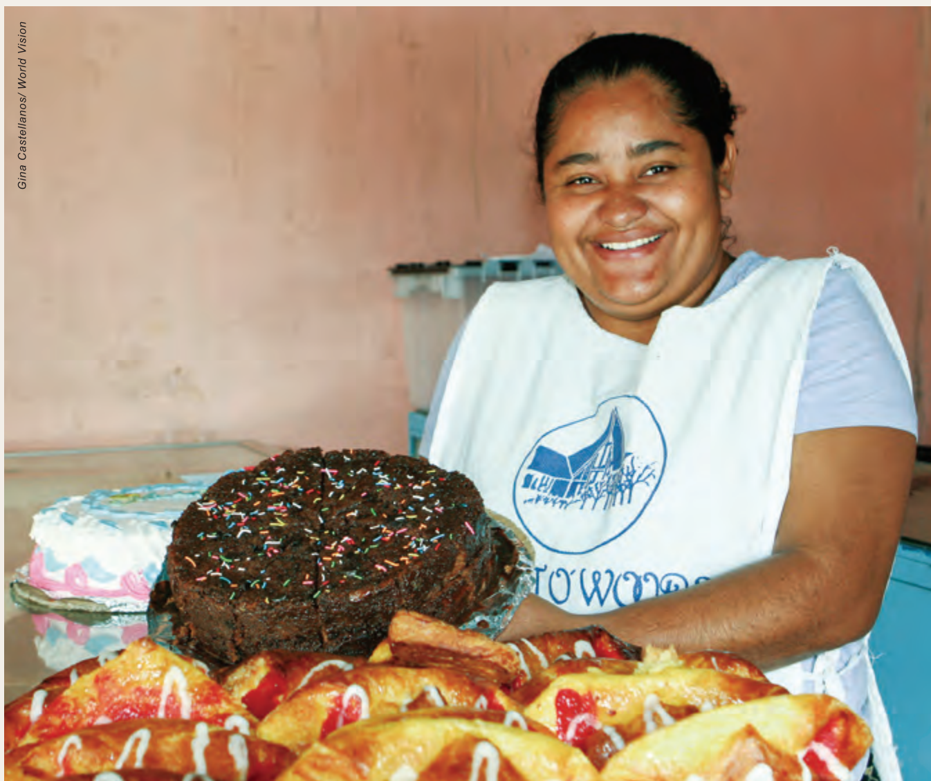
Gina Castellanos / World Vision

研究發現，性別的不平等對經濟發展有負面影響，會限制進步和生產力。性別的固有模式很多時妨礙女性參與經濟活動，把她們限制於家務角色上。同時，宣明會的經驗是，增加家庭收入不一定等於改善家人的生活景況，因為錢用到哪兒才更重要。在固有性別模式下，男人通常決定了家庭收入怎樣使用，女性無從置喙。研究發現，當女性有收入時，她們會把九成用在家庭需要上。如果她們的力量得到提升，有足夠技術去賺取收入，益處是很大的。她們將可爭取更多對資源的使用權，在家居用度方面也會有更大發言權。如果女性有收入，她們就可得到信貸，可以進入金融市場，她們會用自己的收入裨益家庭。因此，投資在女性身上益處最多，因為能影響到家中各人的健康和福祉，從而打破貧困的惡性循環。