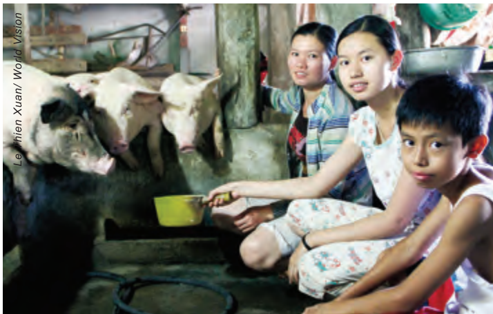
越南的一個家庭，因為養豬大大增加了家庭的收入。宣明會給他們提供飼養訓練。

二〇〇三年宣明會連同當地的機構，在加斯基區推動持久農業和有機耕種。因為當地農民訴說收成不好，年中往往有兩三個月缺糧，也沒有錢去買食物。參加農業訓練的男女子女，學習根據持久農業的原則重新規劃自己的耕地，放棄使用化學肥料和殺蟲劑，以天然方式控制蟲害，以堆肥給土地施肥。持久農業重點在於將生產的各方面整合處理，例如管理耗水問題，使水資源得以持久，又或將動物糞使用於施肥。