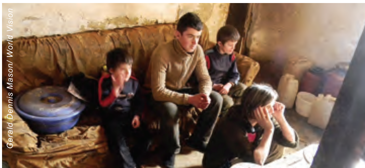
迪勃拉山區的村民生活艱困，每天都在貧困中掙扎求存；而婦女在傳統律法下，更被視為男士的產業。

為了改善這個情況，宣明會工作人員希望婦女能勇於說出心中所想，坦承面對自己生命重要的事情。所