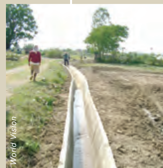
灌溉溝渠把水帶到農田，幫助村民種植額外的農作物。