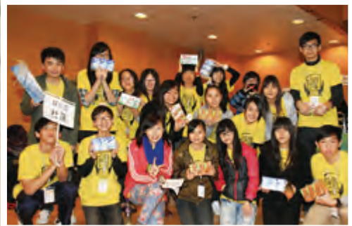
中學生們饑饉24小時，以豆奶和清水體驗貧困孩子缺糧情況。

每年，宣明會透過學校講座及教育活動，讓莘莘學子擴闊視野，了解當今世界所面對的問題，以下是其中兩個重點活動：