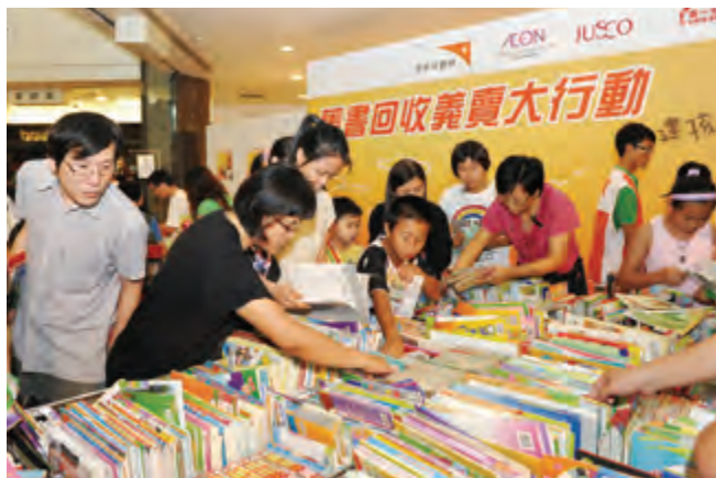
一家大細，三五知己，一邊享受購書樂，一邊祝福貧困孩子。

尖沙咀 The ONE UG2 中庭（鄰近尖沙咀港鐵站B1出口） 8月20-25日 上午11時-晚上9時