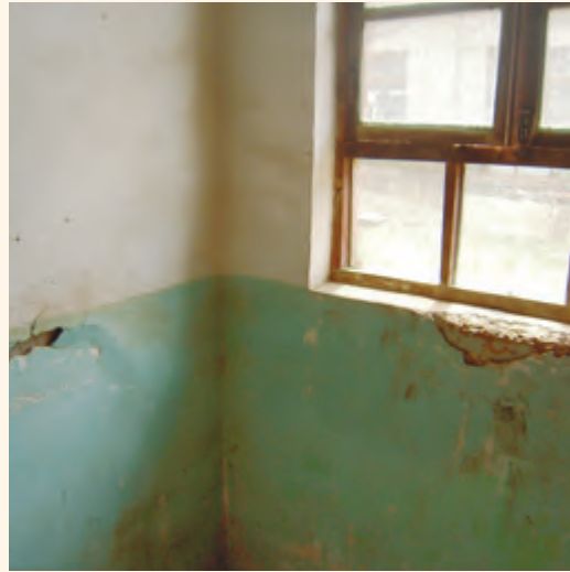
職田中學到處都是裂縫，必須盡快興建新的教學樓。