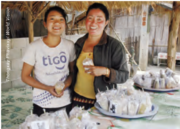
老撾的阿圖和她的女兒以及她們製造的薑茶。