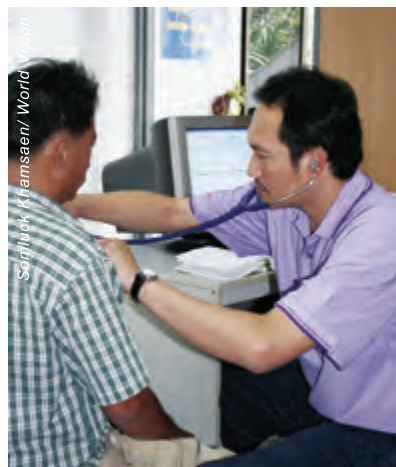
村民現時可以在附近的診所接受健康檢查及醫療服務。