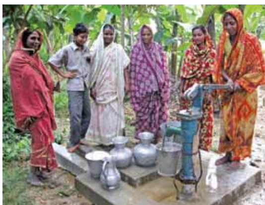
宣明會為社區興建抽水井，令村民獲得清潔用水。

去年，香港世界宣明會在孟加拉的援助款項逾港幣一千六百萬，推行了四個「區域發展項目」及五個較短期的項目，惠及超過一百萬人。