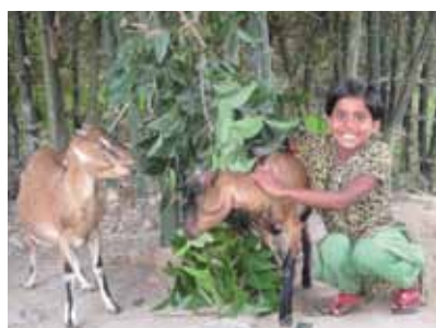
一年前，這名助養女童的家庭獲發兩隻山羊，今天，其中一隻山羊誕下了這兩隻小羊。