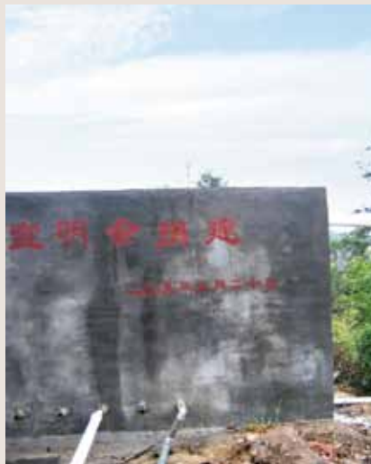
宣明會在鎮上建造的蓄水池。

同學，有不少是住宿生，他們平日洗衣服或洗澡，都會利用學校旁邊的小河，如要飲水，則仰賴山上引下來的水。但由於學校蓄水池和引水池的儲水量有限，無法供應整間學校所需，常有斷水現象，學生惟有向附近的村民取水飲用。 有見及此，宣明會資助學校購置了新水管，亦建造了新的蓄水池和引水池，令學校的儲水量大增。此外，宣明會又資助興建了垃圾池和洗衣台，為師生生活帶來了極大的方便。