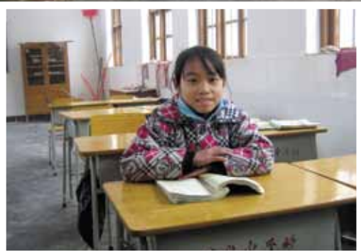
惠鳳喜歡在學校溫習。