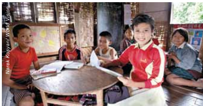
全賴晚間學習班的幫助，十歲菲達艾（紅衣白裙）的英文和數學都進步了，能趕上學校課堂的進度。

十歲的學生菲達艾很高興能參加晚間學習班。「以前，我的英文和數學比較差，但媽媽要照顧弟弟及忙於家務，不能協助我。幸好晚間學習班的老師幫我不斷複習課堂所學的，以致我能趕上課堂的進度。多謝宣明會幫助我們這些不能負擔補習費用的學生！」