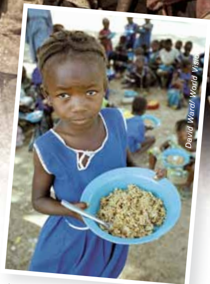
宣明會在非洲塞拉利昂推行學校供餐計劃，讓飢餓的學生們每天也有餐溫飽。

今年，約有5,000名市民已報名 4月17-18日在香港仔運動場舉行的 「30小時饑饉營」及「8小時體驗營」。