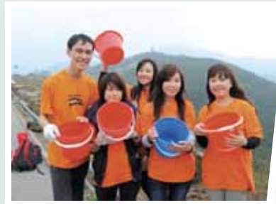
去年YEP成員參加了「體驗貧窮營」，深切體會貧窮人每日長途跋涉取水之苦。

為讓更多不同院校的學生有機會參加，今年特別開放予所有本地全日制專上教育課程（包括高級文憑、副學士及學士）的學生。歡迎登入 www.worldvision.org.hk/yep 了解詳情及報名，截止日期5月20日。