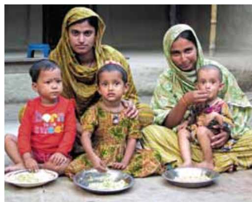
項目地區內的母親們學會了利用當地食材，為孩子烹煮出營養餐，並明白衛生習慣的重要，用以養育子女。