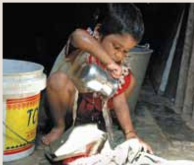
普澤每天要負責洗衣服和餐具。