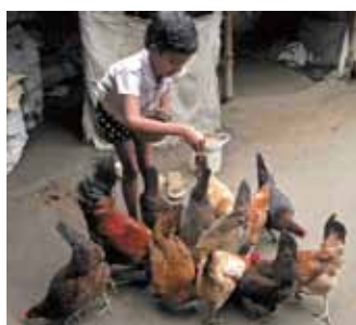
農家庭獲培訓飼養家禽，改善家庭經濟收入。