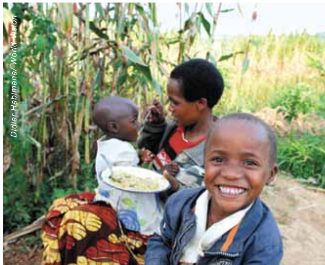
盧旺達一位學會了營養膳食的婦女在家中餵孩子吃營養食物。