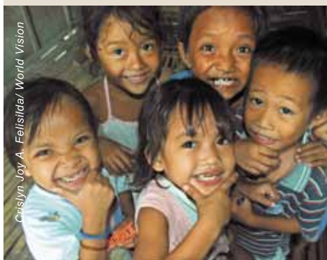
菲律賓一所營養中心內，天真活潑的兒童踴躍拍照。

們到營養中心治療。方法很特別，就是安排營養不良兒童的母親在中心為孩子製作補充營養的食物。每天下午，兒童的母親來到營養中心，按營養師指示的菜單，用很便宜的食材，煮出富有營養的食物。食物包括添加營養的小麵包、湯麵、加了鐵質和草藥葉子的米粥，以及其他蔬菜等。這些母親同時會學習正確的營養知識，怎樣預備有營養的食物，園圃種植的方法和簡單理財等等。