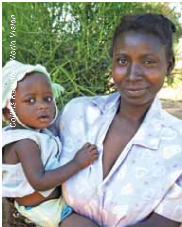
贊比亞的愛倫以為兒子愛華絲會因營養不良死去，幸好在宣明會的診所得到及時治療，可以康復回家。