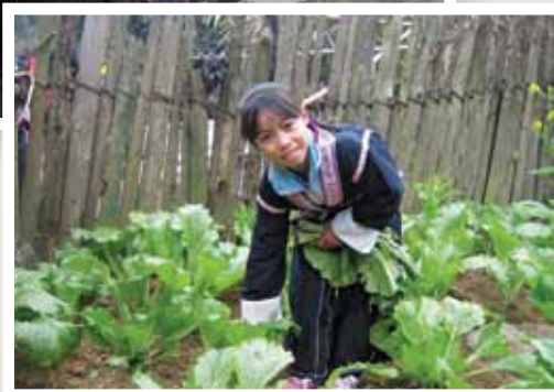
惠鳳經常替爸媽做家務，這天她正忙於摘菜。