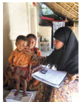
社區上的孩子會被安排參加保健項目，義務衛生工作人員會先為他們量度體重。