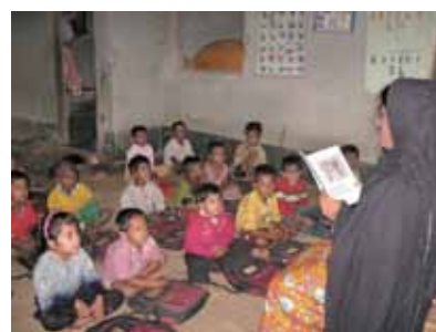
宣明會為即將入讀小學的兒童安排上學前教育班，預備正式上學。