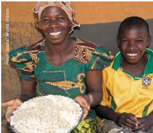
贊比亞的雲弗德展示她的收穫。宣明會給她的種子令她首次豐收。