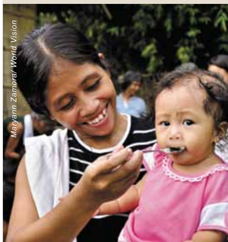
菲律賓的妮能學習煮營養食物，正在餵女兒吃粥。