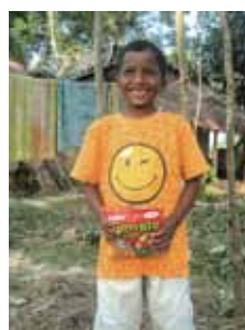
助養孩子收到助養者寄來的禮物，十分雀躍。